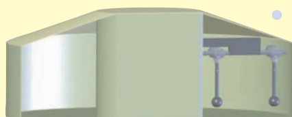
VP1D – Til enkeltroterende blandere.